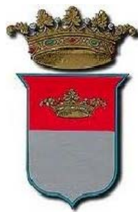
Provincia di AVELLINO